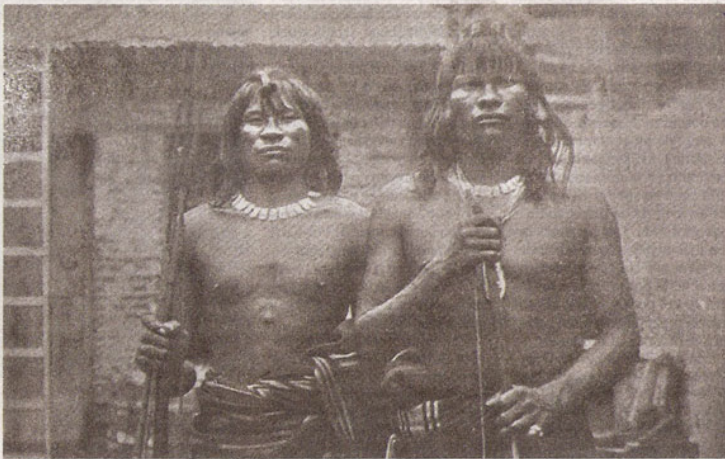
El libro se refiere a los aborígenes masacrados como también a los que sobrevivieron.