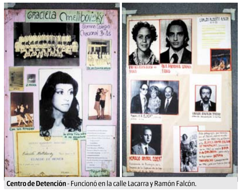
Centro de Detención - Funcionó en la calle Lacarra y Ramón Falcón.